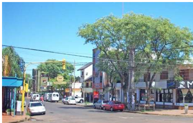
Esq. Av. Centenario y Av. Corrientes

Se dice que "...la casa de negocio de Juan Montejano era el pequeño banco, la caja de ahorro y la asesoría del escaso vecindario", según se extrae de los relatos del libro Histórico de la Escuela N° 110 que funcionó en las inmediaciones a partir de 1922, y que luego se trasladó a Av. Corrientes, en su intersección con calle Tucumán.