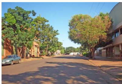
Avenida Domínguez. Vista hacia Avenida Cocomarola.

Localizado al Sudoeste de la Ciudad de Posadas, su nombre rinde homenaje a Don