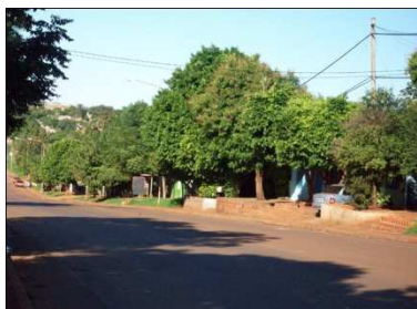
Av. Blas Parera

Desde 1983 en adelante, este Barrio continuó extendiéndose. En 1986, el Consejo General de Educación (CGE) decidió trasladar a la Chacra 128 la escuela N° 298 "Salvador Simsolo", que funcionaba en el Barrio "El Chaquito", en razón del plan de reubicación de los pobladores del mencionado barrio por los efectos de la construcción de la represa de Yacretá. De esta manera el Barrio "San Gerardo" a partir de ese momento contó con un edificio escolar cercano, al que las familias pudieran enviar a sus hijos a estudiar.