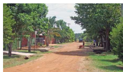
Calle Nº 49