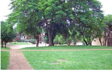
Espacio de Recreación. Parquecito y cancha de fútbol al fondo

En los años 80, la intervención del Instituto de Desarrollo Habitacional - IPRODHA, ejecutó obras a las que denominó por el número de la Chacra donde se ubicaba cada nuevo barrio, como el Barrio "Los Pinos"- chacra 86 - 247 Viviendas.