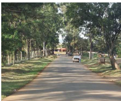
Calle de acceso al barrio desde la RN N°12

En el año 1991 se creó la "Asociación Jardín de los Niños" que funciona en el edificio del "Centro Educativo Integral San Jorge". Esta Asociación, entre otras actividades, creó talleres de capacitación laboral para adultos y la tercera edad y la "Guardería San Jorge" para albergar hijos de madres de escasos recursos económicos. También gestionó ante el Gobierno provincial la creación de la Escuela N° 609 en 1995 la que cuenta con un moderno edificio desde el año 2008. En el mencionado Centro Integral también funciona un Centro Tecnológico Comunitario. Además podemos mencionar el funcionamiento de la Escuela San Ignacio Loyola dependiente de la Orden de los Jesuitas.