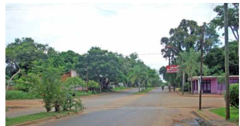
Esq. Av. Areco y Alem