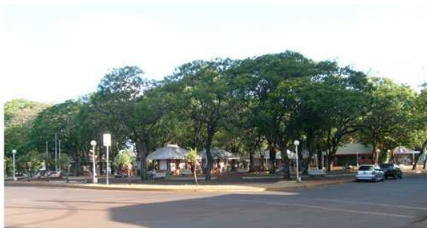
Parque República del Paraguay

Es importante destacar que en la jurisdicción del Barrio "Villa Sarita", funciona el Club de Fútbol considerado como uno de los más populares de la Provincia, el "Club Deportivo Guaraní Antonio Franco", fundado en el año