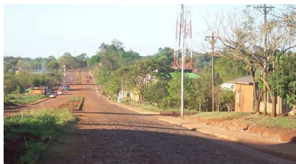
Av. Juan José Paso

En jurisdicción del Barrio San Marcos se encuentra erigida la "Capilla San Marcos" situada en Intersección de Calles N° 158 (Las Camelias) y Calle N° 65. Asimismo sobre la calle N° 152 casi intersección con la calle 71, funciona la escuela Provincial N° 122. Y para el esparcimiento de los habitantes del lugar entre calles 150 y 65 existe un espacio verde en el cual sobresale una Cancha de Fútbol, muy concurrida los feriados y fines de semana.