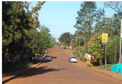
Av. Península de Valdéz

Por otra parte cuenta con una plazoleta al costado de la escuela “Puerto Argentino” (Sobre calle Magallanes intersección con calle Ramón Acosta, donde existe un parque infantil en el marco de un espacio verde donde también se desarrollan actividades o reuniones de festejos para mayores y para niños. También sobre la calle Ramón Acosta casi Calle P. Moreno, se erige la capilla “San Mateo” a la que concurren números feligreses vecinos de este Barrio.