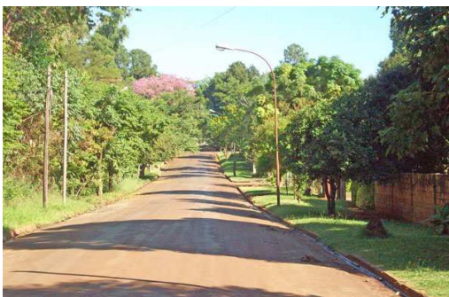
Calle Jardín América

El barrio Luís Piedrabuena, forma parte de la Delegación Municipal "Itaembé-Mini", estando localizado entre la Ruta Nacional N° 12 y la Ruta Provincial N° 213, hacia el Sudoeste de Posadas.