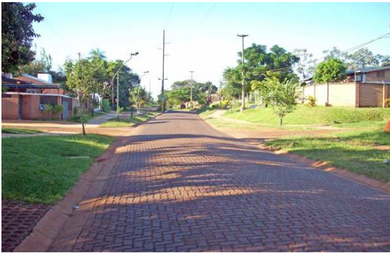
Avenida Tomás Guido. (Tramo entre Avenidas Andresito y Santa Cruz).

Situado en una de las zonas más alta del Municipio de Posadas, aproximadamente a 120 metros sobre el nivel del mar, desde este barrio se observa un panorama muy atractivo de los edificios que forman parte del casco céntrico de Posadas, de ahí el nombre " Alta Gracia ".