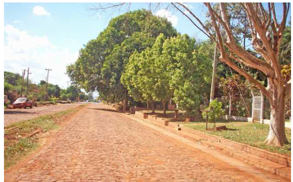
Avenida Zapiola. Vista hacia Avenida Tambor de Tacuarí.

Barrio Posadeño localizado al Oeste de la ciudad, está delimitado por las Avenidas Tambor de Tacuarí, López y Planes, Zapiola y Aguado, ocupando la Chacra 105 y formando parte de la Delegación Municipal Villa Cabello.