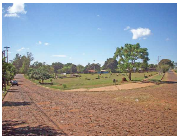
Plazoleta y espacio de recreación, sobre calle Los Lirios.

En el caso del denominado "Barrio Virgen de Fátima A-3-2", la Entidad Binacional Yacyretá procedió a la adquisición de terrenos correspondientes a la sección Catastral Nº 5 de la Municipalidad de Posadas, sector ubicado detrás del Barrio conocido con el nombre de "Don Ricardo", para relocalizar a los afectados por el llenado del embalse de la Represa Yacyretá. De esta manera surgió el complejo habitacional área A-3-2 construido entre 1.992 y 1.998, en su mayoría compuesto por pobladores procedentes de los barrios El Chaquito y Villa Urquiza.