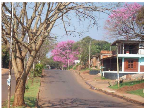
Av. López Torres

El Barrio "Parque Adam" está delimitado en el Sur de esta ciudad por la Avenida Tierra del Fuego, Avenida Comandante Espora, Avenida Rademacher y Calle Carlos Grismado. (Cabe aclarar que el límite marcado por esta última vía, actualmente ha sido transformado por las obras de la nueva costanera de la ciudad).