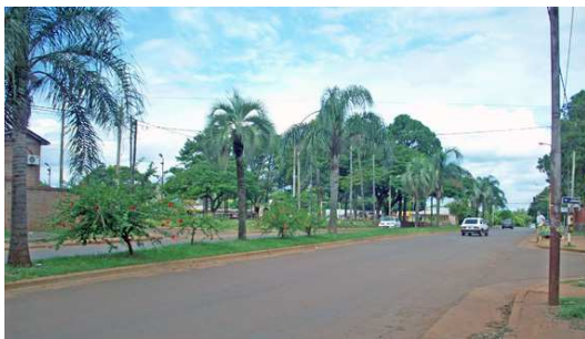
Esq. Av. Areco y Magaldi