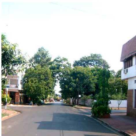
Calles España y Pedro Méndez.