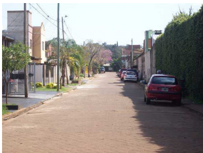
Calle Frondizi (Calle interna del barrio). Vista desde Av. Lavalle